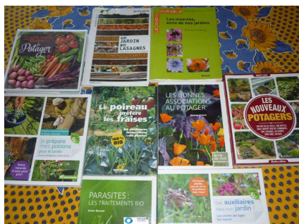
Guides de détermination et d'écologie

Composition de la mallette pédagogique « biodiversité et insectes » :