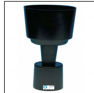
Appareil de Berlèse