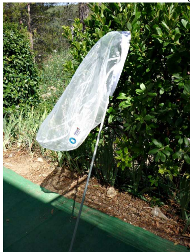
Filet à insectes