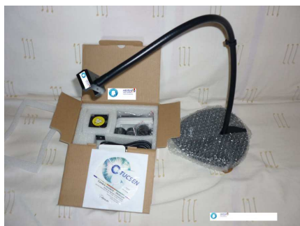
Caméra sur flexible