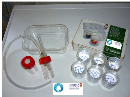
Aspirateurs à insectes et boîtes loupe